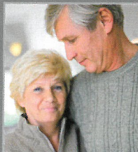
Table ronde : Améliorer son habitation pour favoriser le maintien à domicile

VOUS SOUHAITEZ BIEN VIEILLIR CHEZ VOUS DANS VOTRE LOGEMENT VOTRE QUARTIER VOTRE COMMUNE